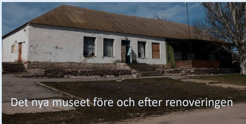
Det nya museet före och efter renoweringen