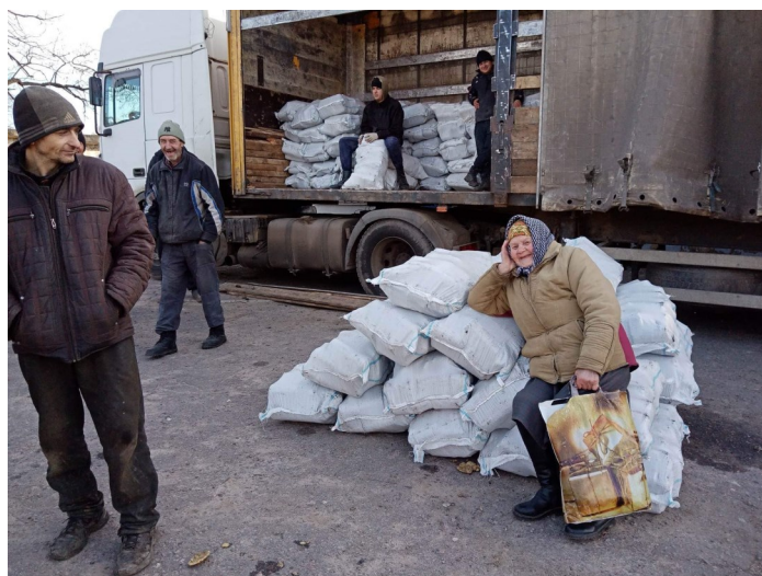
Briketter levererade till alla bushåll

Följ vår rapportering på www.svenskbyborna.se eller vår facebookside Svenskbyborna