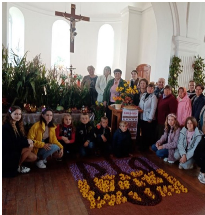
Tacksägelsegudstjänst under ockupationen

Byn är utan el, vatten och internet. De har inte heller bränsle för att kunna hålla husen varma inför vintern, som nu knackar på dörren. Det kan också bli aktuellt med evakuering till säkrare platser om det krävs.