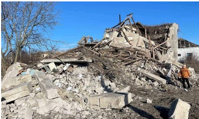
Gammalsvenskby hösten 2023

Sedan kriget startade i februari 2022 har föreningen minst en gång i veckan, oftast dagligen rapporterat vad som händer i byn. Det är viktigt för byborna, såväl för alla som bryr sig om byn och dess invånare. Det har blivit ett viktigt verktyg även från media som behöver korrekt och bekräftad information.