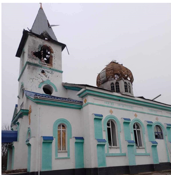
Prästen i byn och vi arbetar för att bygga upp kyrka igen

Vi måste fortsätta kämpa för byns framtid. Byn har byggts upp förr. Den ska byggas upp igen.